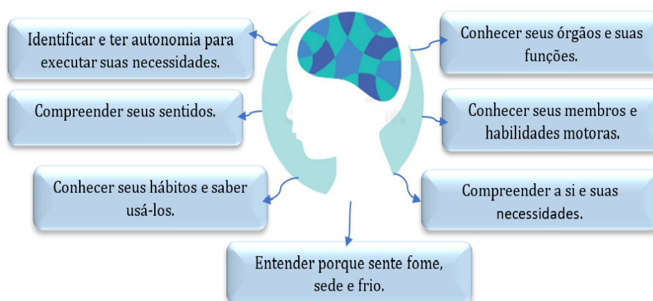
Figura2 – Habilidades fundamentais para a aprendizagem da criança na concepção decroliana.