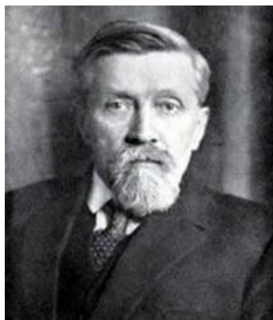
Figura 1 - Jean Ovide Decroly.