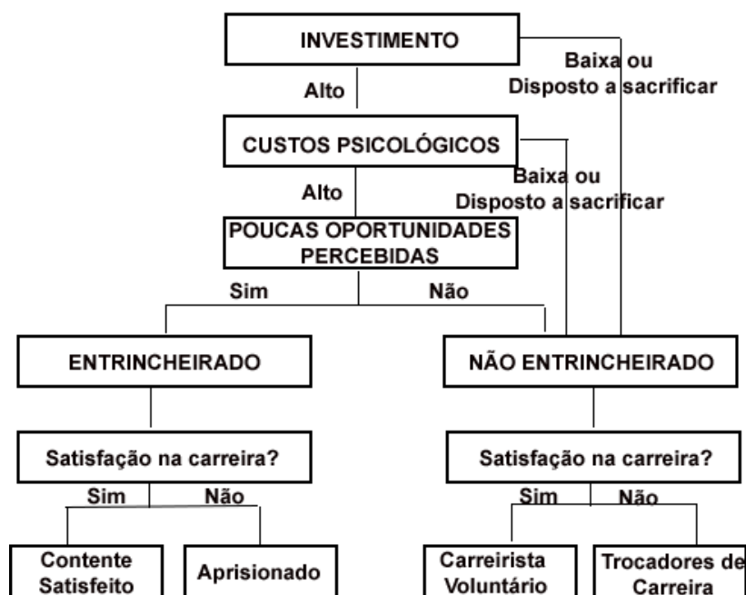
Figura 1. Modelo de Entrincheiramento de Carreira

Fonte: Traduzida pela autora de Carson, Carson e Bedeian (1995).