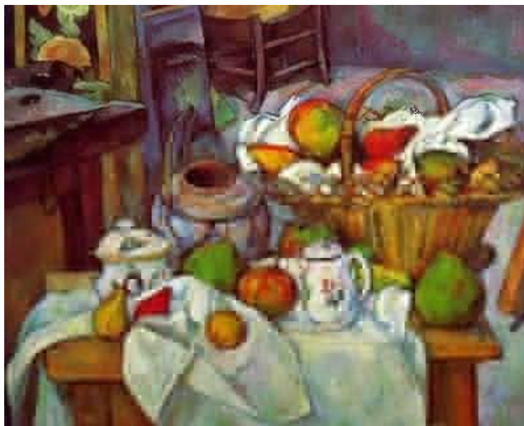
Figura 3: Natureza morta com cesta de frutas (1888-1890), Paul Cézanne