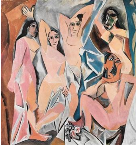
Figura 4: Les Femmes d'Alger (O Version O) , Pablo Picasso, 1907

A ruptura causada pelo cubismo, asseveram Reis, Guerra e Braga (2005), é a conexão entre Arte, Ciência, matemática e tecnologia, perspectiva compartilhada por Gomes, Di Giorgi e Raboni (2011, p.7, destaque do autor), que afirmam “ao introduzir a ideia central da simultaneidade, Picasso apresenta, no quadro Les Femmes d'Alger (O Version O) (1907), características de pinturas egípcias, maias e incas. A questão de simultaneidade é uma das bases da teoria da relatividade de Einstein”. Dessa maneira, podemos notar a ligação entre as ideias que permeavam tanto as Artes Visuais quanto a Ciência no início do século XX, promovendo rupturas e mudanças que acompanhariam as duas áreas durante todo o século.