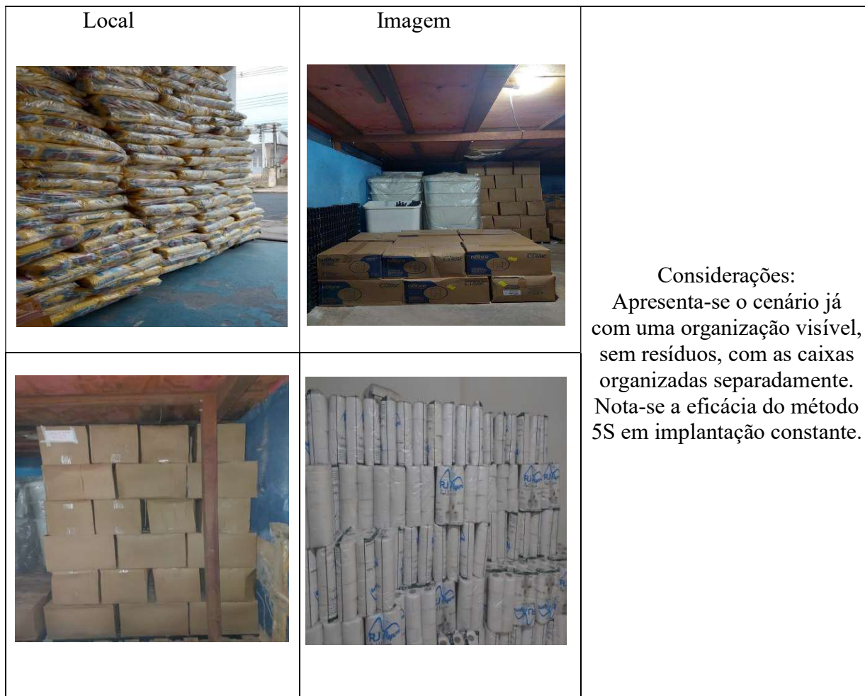
Quadro 08: Cenário com a execução das oito etapas propostas - Almoxarifado da Saúde. Local – Unidade 02.