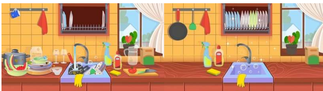
Imagem 02: Ilustração comparativa entre o antes e depois da aplicação do método 5s.

O autor conclui que com menos esforço e em menos tempo os colaboradores da cozinha conseguiriam um resultado muito melhor, além de diminuir o risco de perda de peças mais frágeis por acidentes. O exemplo aplicado mostra a importância da organização e da limpeza, partindo da padronização do processo. Conforme imagem 02, vemos o exemplo de uma cozinha antes e depois da aplicação do método 5S.