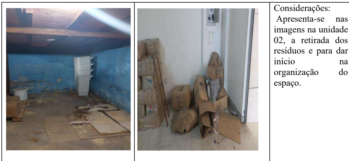
Quadro 07: Cenário durante aplicação de senso de limpeza - Almojarifado da Saúde. Local – Unidade 02.

Em seguida, na etapa 06, foi enfatizado o senso de limpeza como um reforço aos sentidos anteriores aplicados. O objetivo era garantir uma manutenção recorrente e rotineira, de forma a evitar a geração de excesso de resíduos no setor.