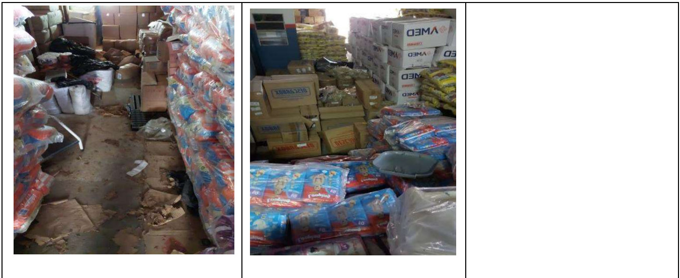
Quadro 05: Cenário Inicial - Almoxarifado da Saúde. Local – Unidade 02 Fonte: Resultados da pesquisa.

Com o intuito de garantir uma avaliação criteriosa, garantir a confiabilidade de que o método 5S é funcional e obter um histórico da implantação do método, foi feito o registro fotográfico inicial apresentado como resultado comparativo.