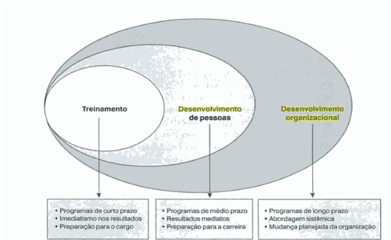
FIGURA 1 - Os estratos de treinamento, desenvolvimento de pessoal e desenvolvimento organizacional.

Robbins (2006, p. 170) define Desenvolvimento organizacional como uma série de intervenções de mudança planejada, com base em valores humanos e democráticos, que buscam melhorar a eficácia organizacional e o bem-estar dos funcionários. Logo não se deve enxergar o D.O como um fator isolado de estrutura homogênea, pelo contrário se deve levar em conta que ele é formado por uma estrutura heterogênea e com base nas pessoas como mostra a figura 1 a seguir.