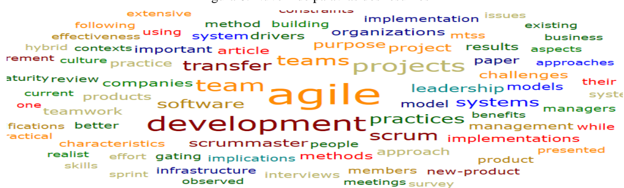
Figura 6: Nuvem de palavras dos resumos

A escolha dos artigos foi orientada pelos resultados obtidos no passo a passo da aplicação de avaliação bibliométrica. Checando o resultado da filtragem dos 12 artigos com o software EndNote por meio de uma nuvem de palavras, que pode ser vista pela figura 6, gerada no software Atlas.ti a partir dos resumos destes artigos, percebeu-se a repetição de palavras constantes na string de busca: leadership, development, software, Scrum Master . Também foram percebidas palavras como agile, team, teams, scrum, management que estão relacionadas com tema.