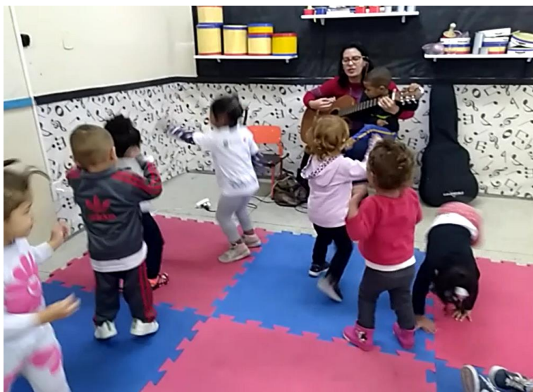
Figura 03– Atividade tipo A.2