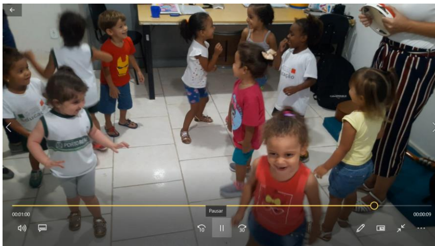
Figura 02– Atividade tipo A.1