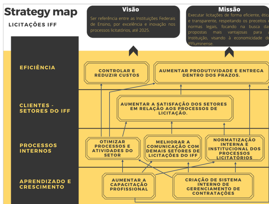
Figura 8: Mapa Estratégico

A planilha apresentada na figura 7 servirá como base para a criação de planos de ação operacionais separados por áreas e processos do setor. A conclusão do planejamento estratégico foi a criação de um mapa estratégico para o setor, apresentado na figura 8.