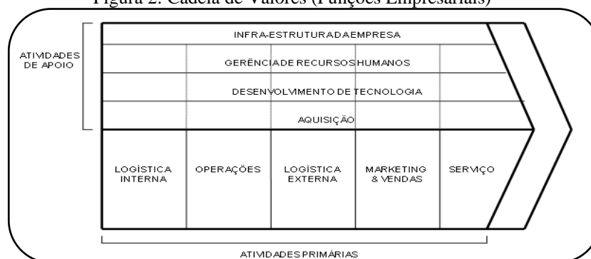
Figura 2: Cadeia de Valores (Funções Empresariais)

Em relação à análise do ambiente interno da organização e de seus fatores positivos e negativos, é importante olhar para as suas funções empresariais (cadeia de valores). Para Porter (1990), toda empresa é um conjunto de atividades que são executadas para projetar, produzir, comercializar, entregar e sustentar seu produto. Segundo o autor, essas atividades podem ser representadas por meio de sua cadeia de valores, que representa, em conjunto com o modo como executa suas atividades, o reflexo de sua história, estratégia e método de implementação e economia básica. A figura 2 representa essa cadeia de valores com as funções empresariais.