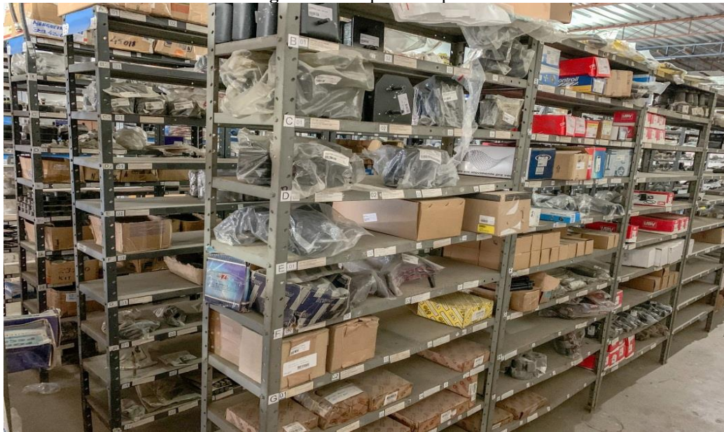
Figura 2: Estoque da empresa